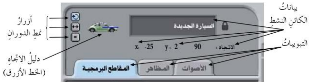
الشكل (٢-١٣): منطقة التحكم.

وتتكوّن منطقة التحكم المبيّنة في الشكل (٢-١٣) من الأجزاء الآتية: